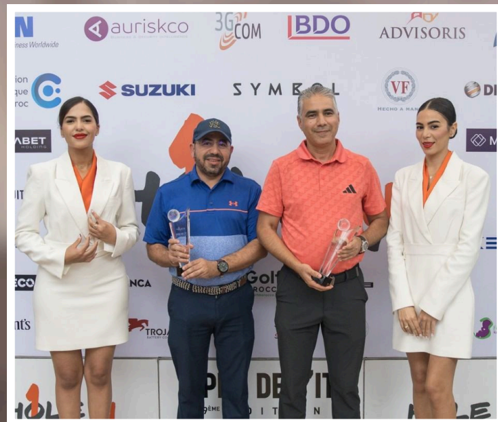
BDO, partenaire de l'Open de l'IT