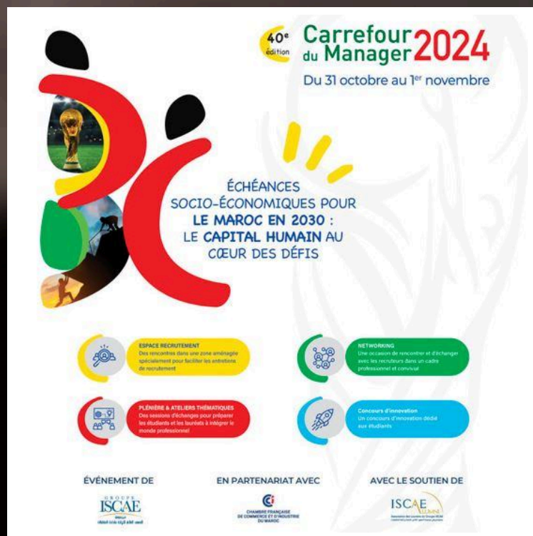
BDO à la 40e édition du Carrefour Du Manager 2024