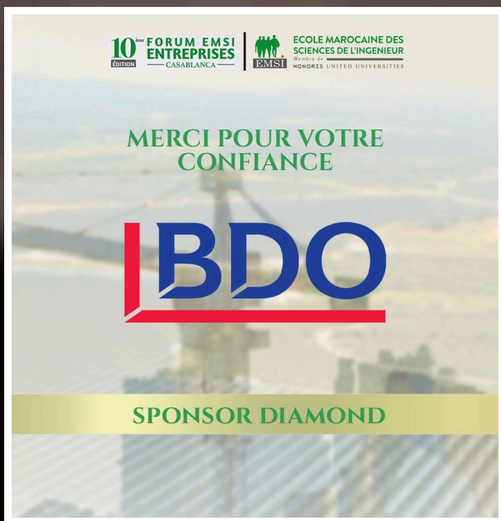
BDO, Partenaire Diamond du Forum des Étudiants de l'EMSI